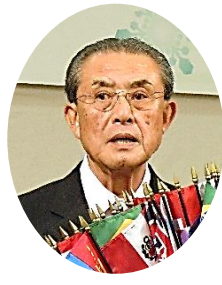
岐阜西ライオンズクラブ 第31代会長を担われ、東日本大震災支援のため、気仙沼へも足を運ばれました。