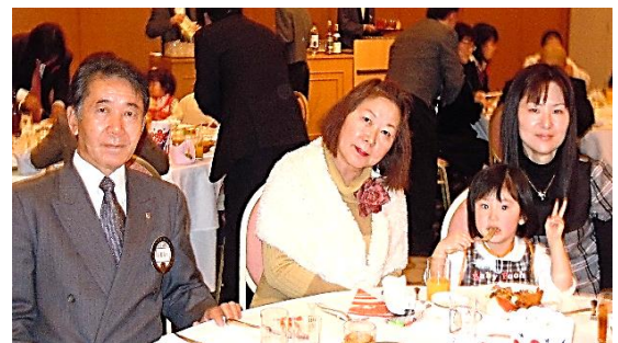
姉妹提携調印式 京都嵐山ライオンズクラブ