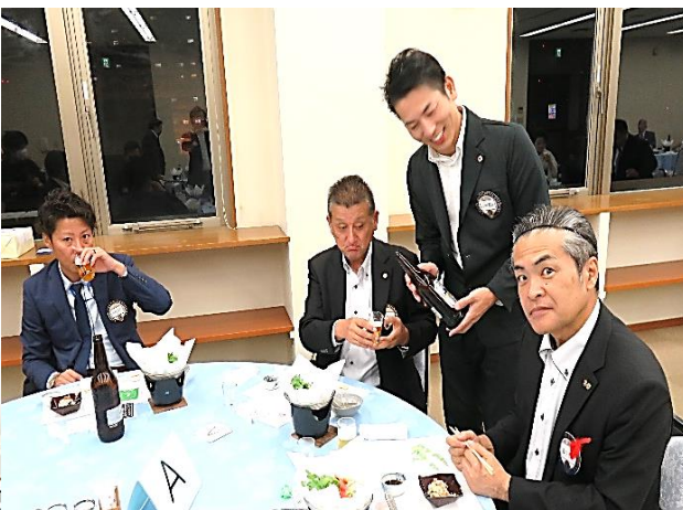
新会員を囲んで和やかに懇親